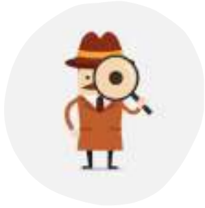
JEU DE PISTE