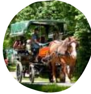
BALADE EN CALÈCHE