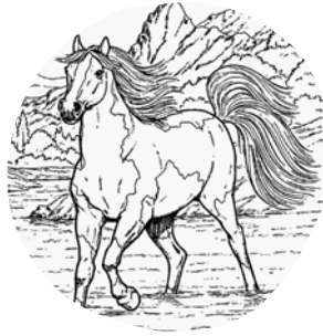
JEUX ANCIENS, LECTURE & COLORIAGE