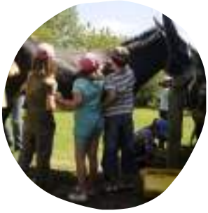
PANSAGE DES ÂNES